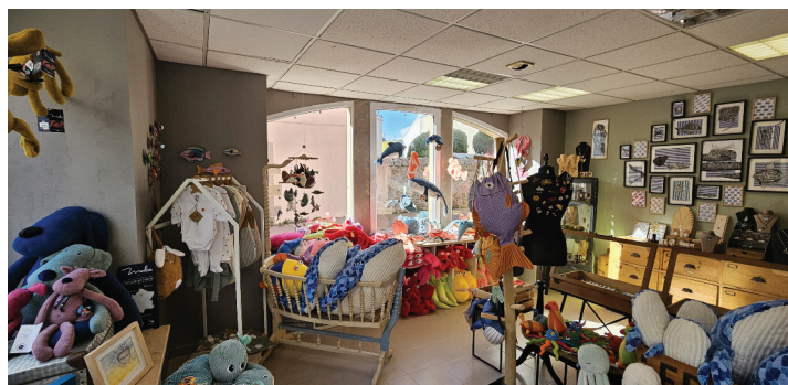
Petit Glaz - 62, rue de la Marine